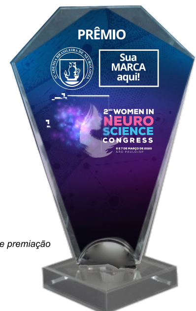
Troféu de premiação